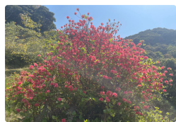
(オンツツジ：4月中旬)