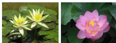
(スイレン・ハス：6月中旬～)