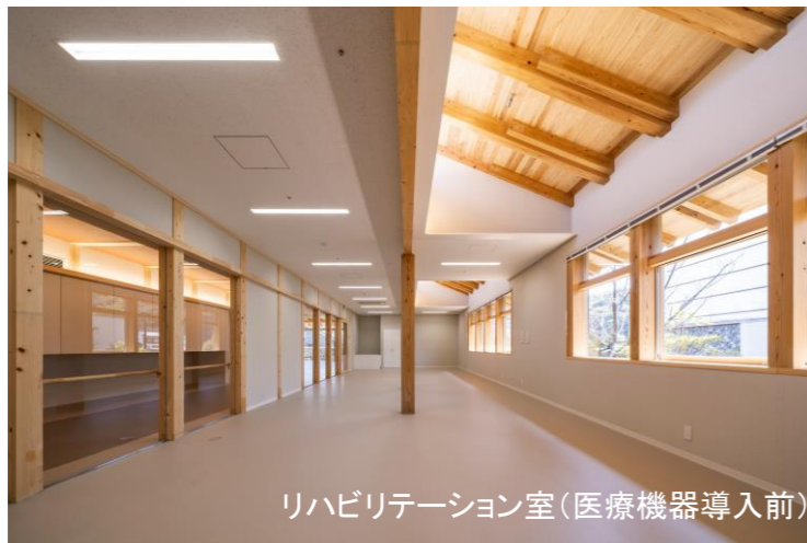
リハビリテーション室(医療機器導入前)