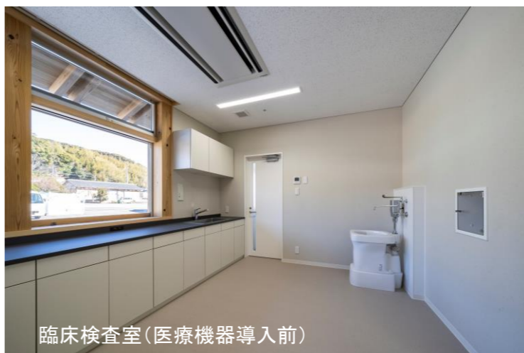
臨床検査室(医療機器導入前)