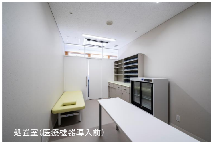
処置室(医療機器導入前)