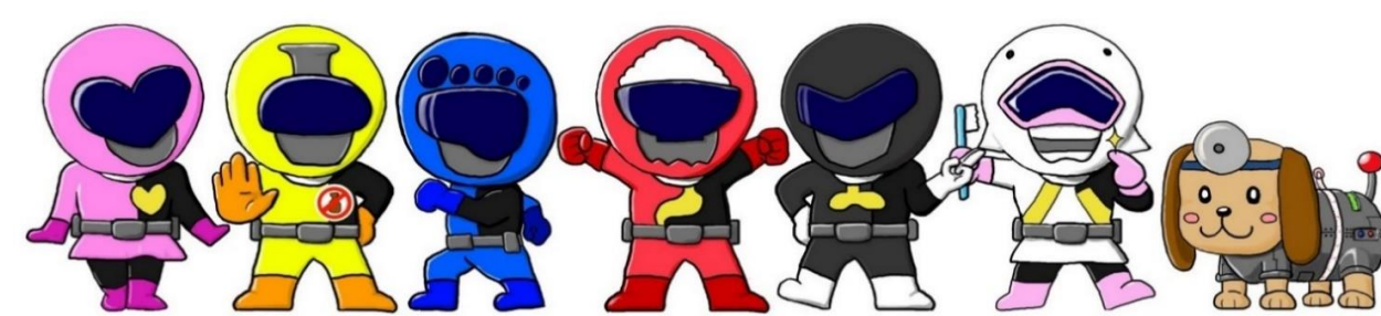
むろと健康戦隊 ヤンテラレンジャー