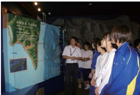
見学者に施設の説明

商工観光深層水課 海洋深層水推進班 （室戸）海洋深層水アクアファーム ☎2412822