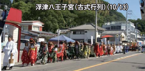
浮津八王子宮(古式行列)(10/13)