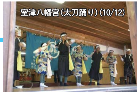
室津八幡宮(太刀踊り)(10/12)