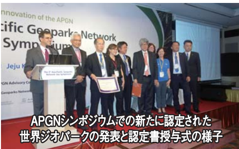
APGNシンポジウムでの新たに認定された世界ジオパークの発表と認定書授与式の様子

今年の9月には、イタリアのチレントおよびヴァッロ・ディ・ディアノーで第12回ヨーロッパジオパークネットワーク(EGN)会議、韓国の済州島で第3回アジア太平洋ネットワーク(APGN)シンポジウムがありました。EGN会議は、基本的に毎年開催されており、慣れている人が多いこともあってか、皆さんとてもリラックスしている感じで、参加しやすい雰囲気でした。休憩時間なども長めに設定されていて、参加者同士が自由に交流する時間が持てました。一方、APGNシンポジウムでは、ホテルが会場で、コンベンションセンターのスタッフが事務局を運営していたりして、カッチリとスケジュールどおりに進められました。APGNシンポジウムの参加者は、約560人でしたが、日本からも100人以上が参加しました。兵庫県立豊岡高校の2年生と3年生9人も参加し、ポスター発表をしています。