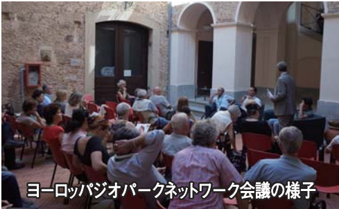
ヨーロッパジオパークネットワーク会議の様子